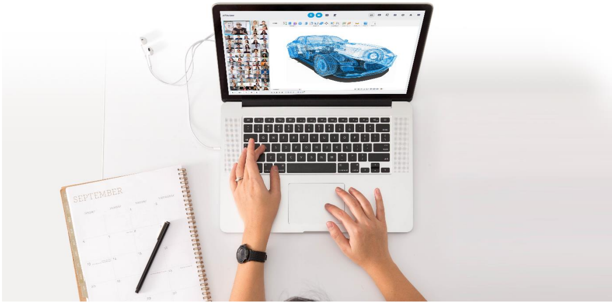
Bildtitel: Remote Revolution